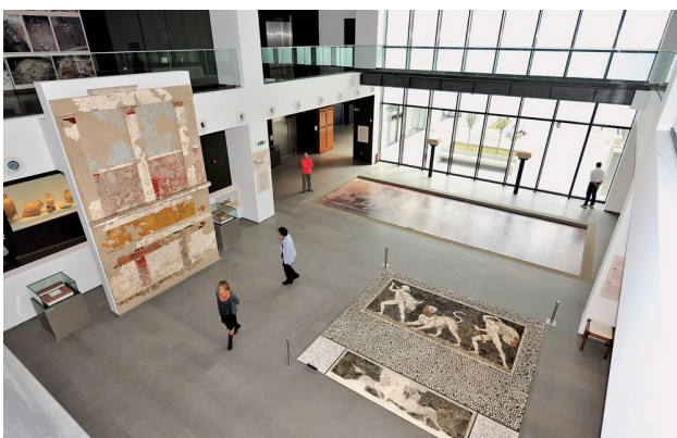
Museum of Pella

In the afternoon return to Thessaloniki.